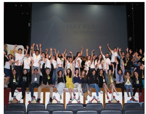
Voluntarios en Querétaro 2016