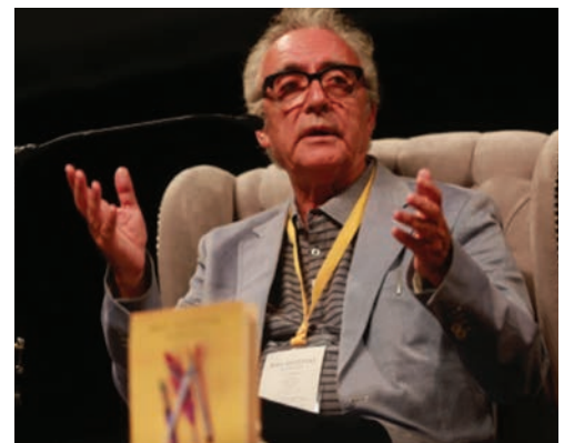
Juan José Millás