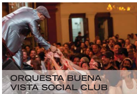
ORQUESTA BUENA VISTA SOCIAL CLUB