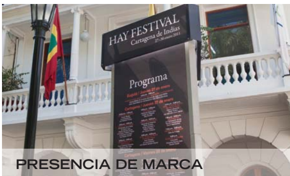
PRESENCIA DE MARCA