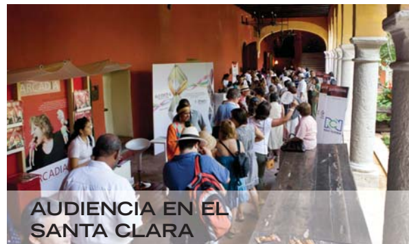
AUDIENCIA EN EL SANTA CLARA