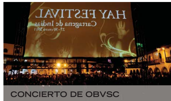
CONCIERTO DE OBVSC